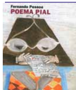
Poema Pial de Fernando Pessoa Ilustrações de Manuela Bacelar