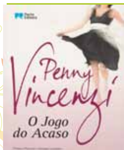
O Jogo do Acaso de Penny Vincenzi