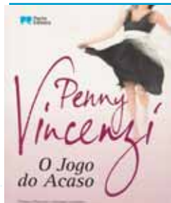
O Jogo do Acaso de Penny Vincenzi