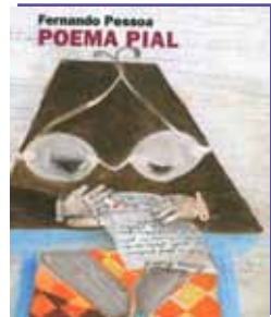
Poema Pial de Fernando Pessoa Ilustrações de Manuela Bacelar