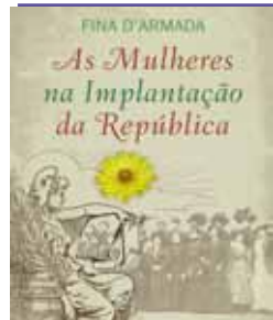
As Mulheres na Implantação da República de Fina D'armada