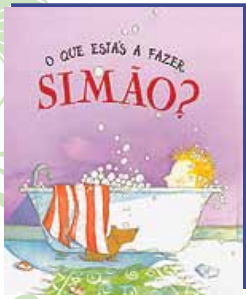
O que estás a fazer Simão? de Marie-Louise Gay