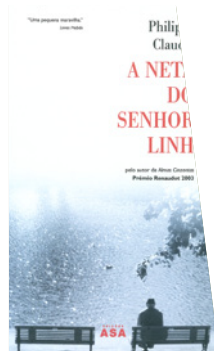
A NETA DO SENHOR LINH Philippe Claudel