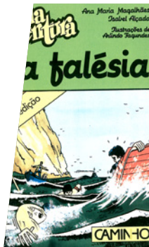
NA FALÉSIA Ana Maria Magalhães Isabel Alçada