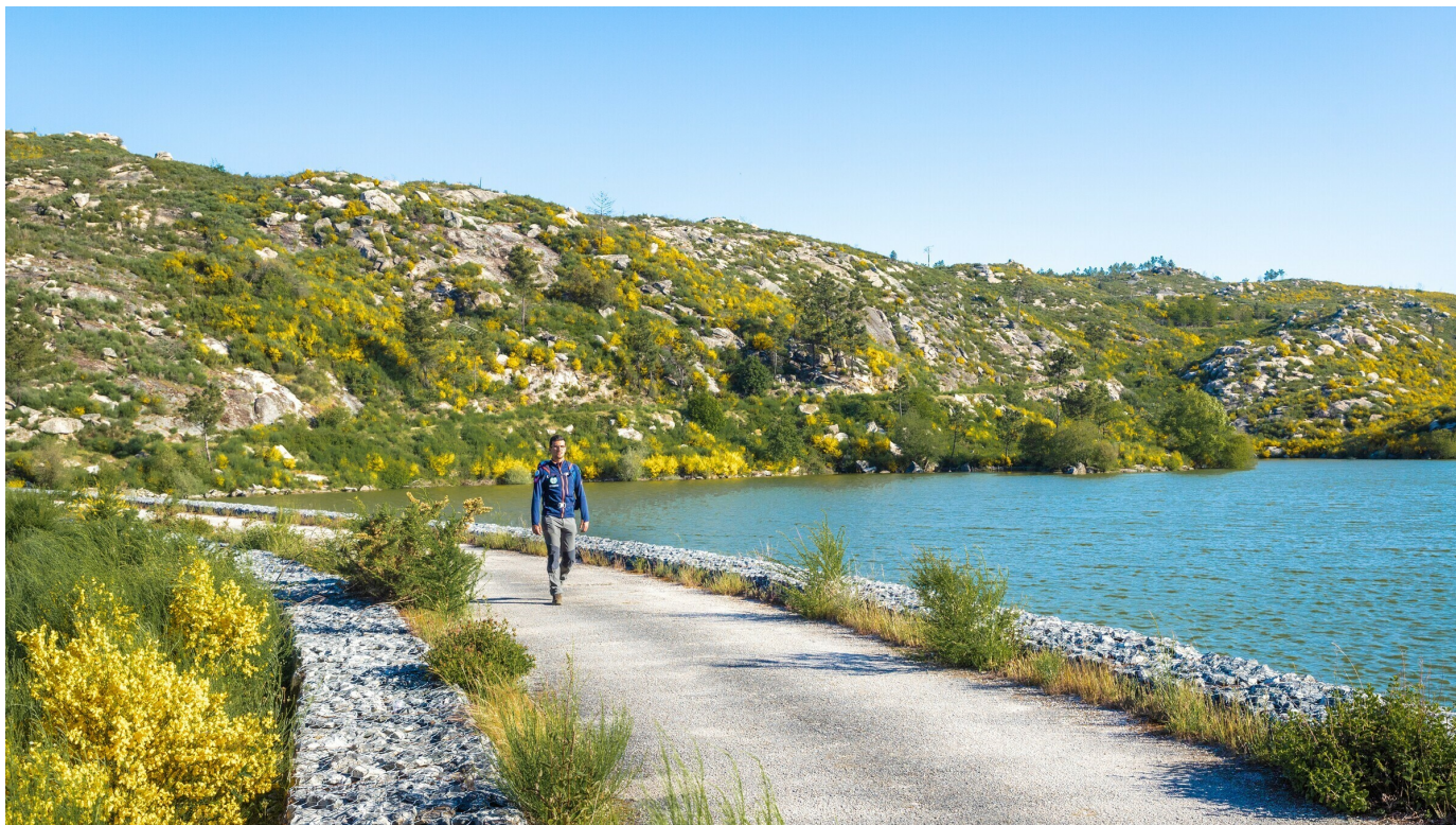
Trilho de Sanfins do Douro

O concelho de Alijó tem uma nova rede municipal de trilhos com mais de 200 quilómetros, que interliga todas as freguesias e locais de interesse turístico, paisagístico e cultural. A rede concelhia passa agora a contar com 20 percursos pedestres – há 17 novos trilhos que se juntam aos três já existentes, todos homologados pela Federação de Campismo e Montanhismo de Portugal.