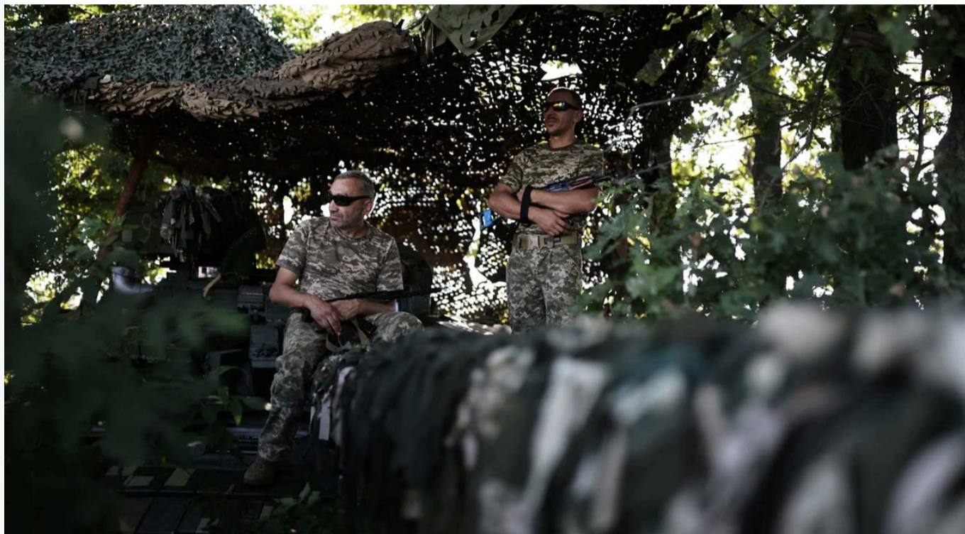
Tropas ucranianas em Kharkiv.

Acompanhamos aqui todos os desenvolvimentos sobre a ofensiva militar desencadeada pela Rússia na Ucrânia.