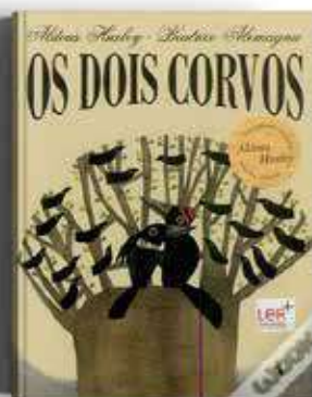
OS DOIS CORVOS ALDOUS HUXLEY E BEATRICE ALEMAGNA