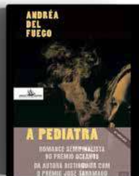
A PEDIATRA ANDRÉA DEL FUEGO