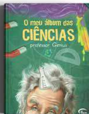
O MEU ÁLBUM DAS CIÊNCIAS PROFESSOR GENIUS