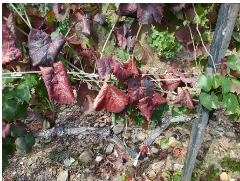
Videira com sintomas de Flavescência Dourada

Deverá ser guardado um registo da data da realização do tratamento, do produto utilizado e da dose aplicada , para efeitos de futuro controlo.