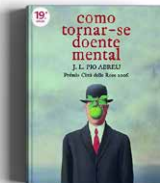
COMO TORNAR-SE DOENTE MENTAL J. L. PIO ABREU