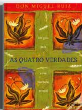
AS QUATRO VERDADES DON MIGUEL RUIZ