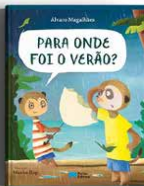
PARA ONDE FOI O VERÃO? ÁLVARO MAGALHÃES