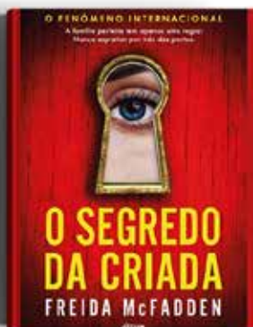
O SEGREDO DA CRIADA FREIDA McFADDEN