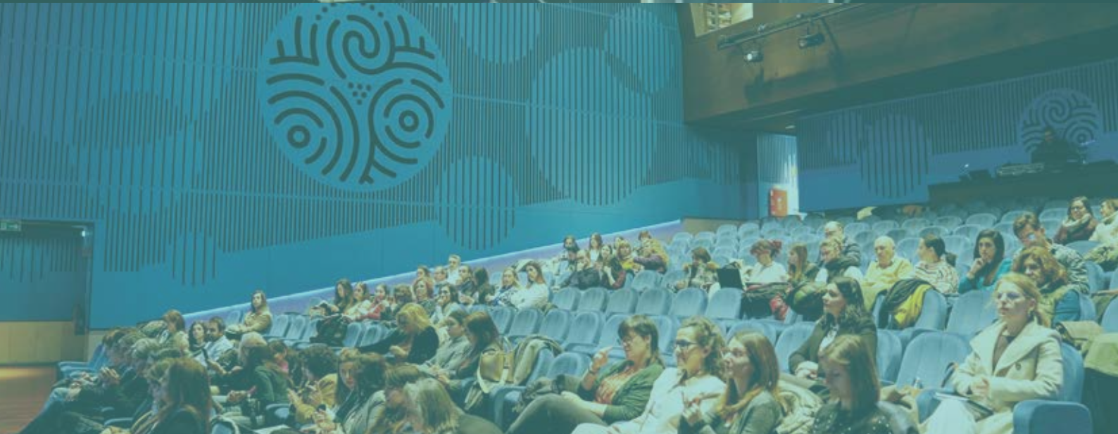
CONFERÊNCIA “INOVAR E TRANSFORMAR COMUNIDADES”