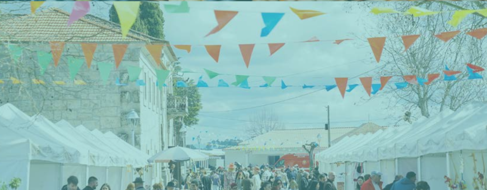
FEIRA DA AMÊNDOA - PEGARINHOS