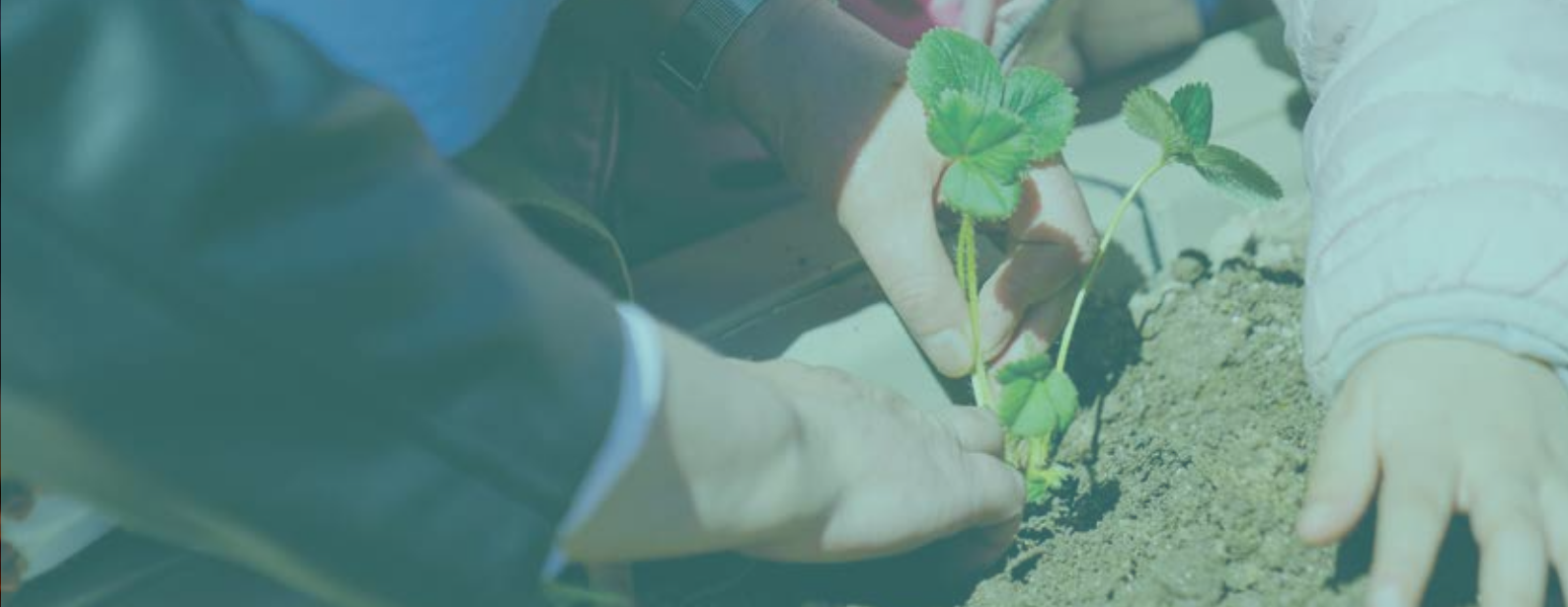
COMEMORAÇÃO DO DIA DA ÁRVORE E DA POESIA