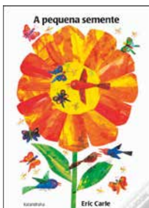
A PEQUENA SEMENTE ERIC CARLE