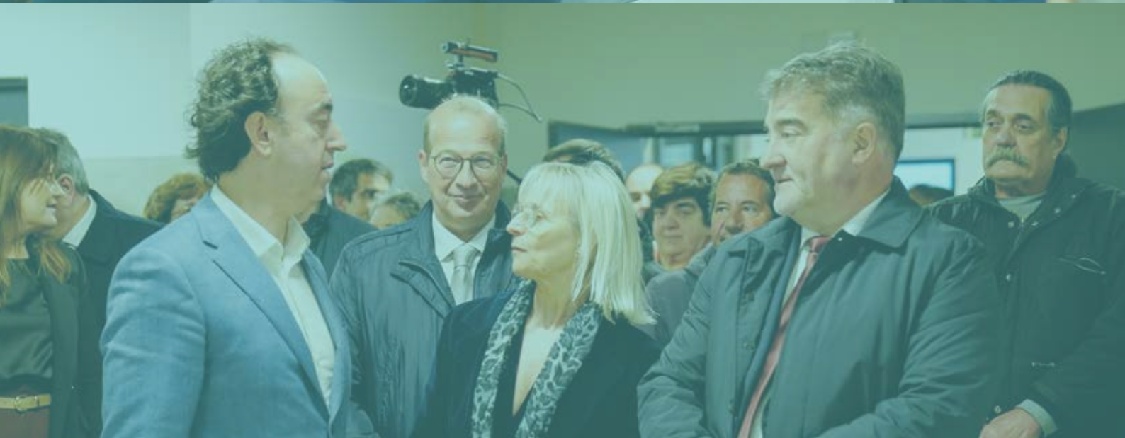
INAUGURAÇÃO DO CENTRO INTERPRETATIVO D'OLIVAL AO AZEITE D'OURO