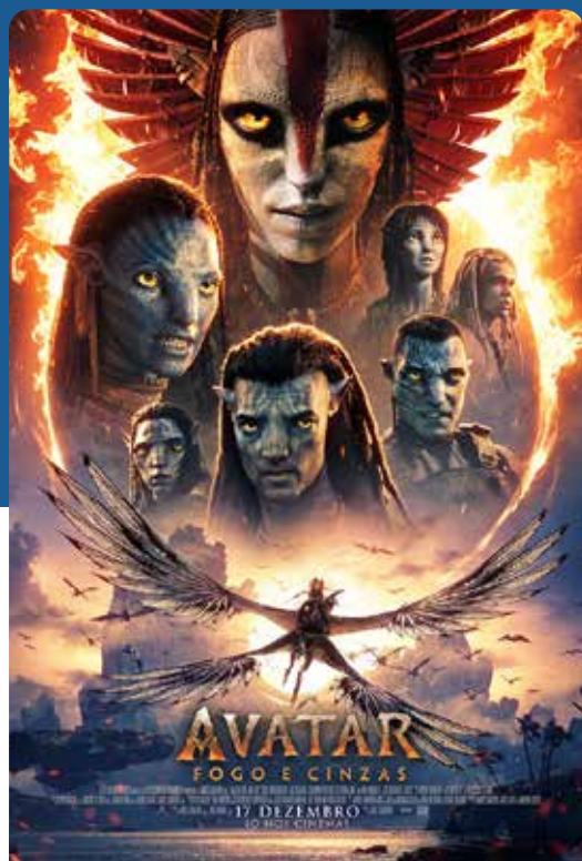
AVATAR FOGO E CINZAS