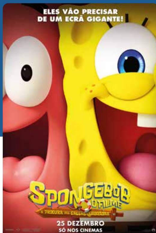
SPONGEBOB O FILME