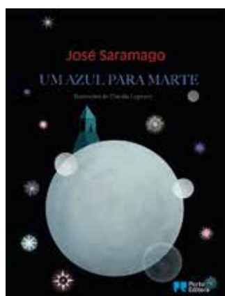
UM AZUL PARA MARTE JOSÉ SARAMAGO