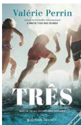
TRÊS VALÉRIE PERRIN